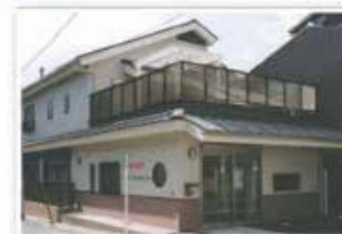
ひなぎくの丘デイサービスセンター TEL. 075-465-0133

ホームページ http://care-net.biz/26/daisy-hill/