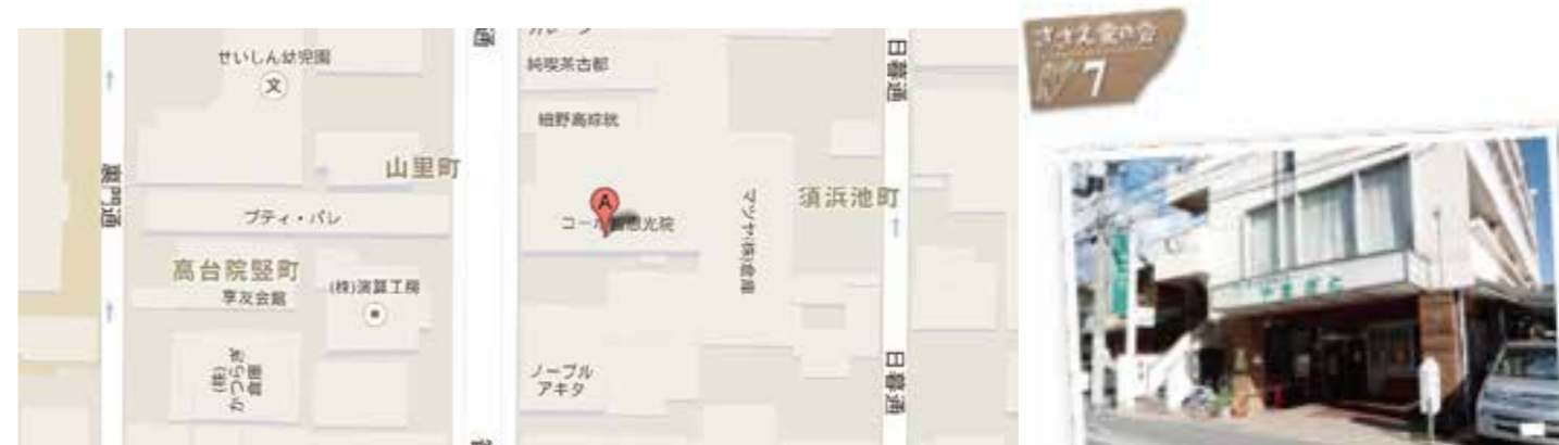
7 デイサービスセンターやまざと TEL. 075-431-2358