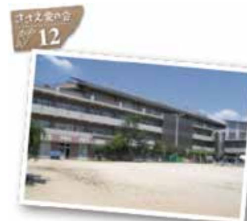
小川老人デイサービスセンター TEL. 075-415-8840